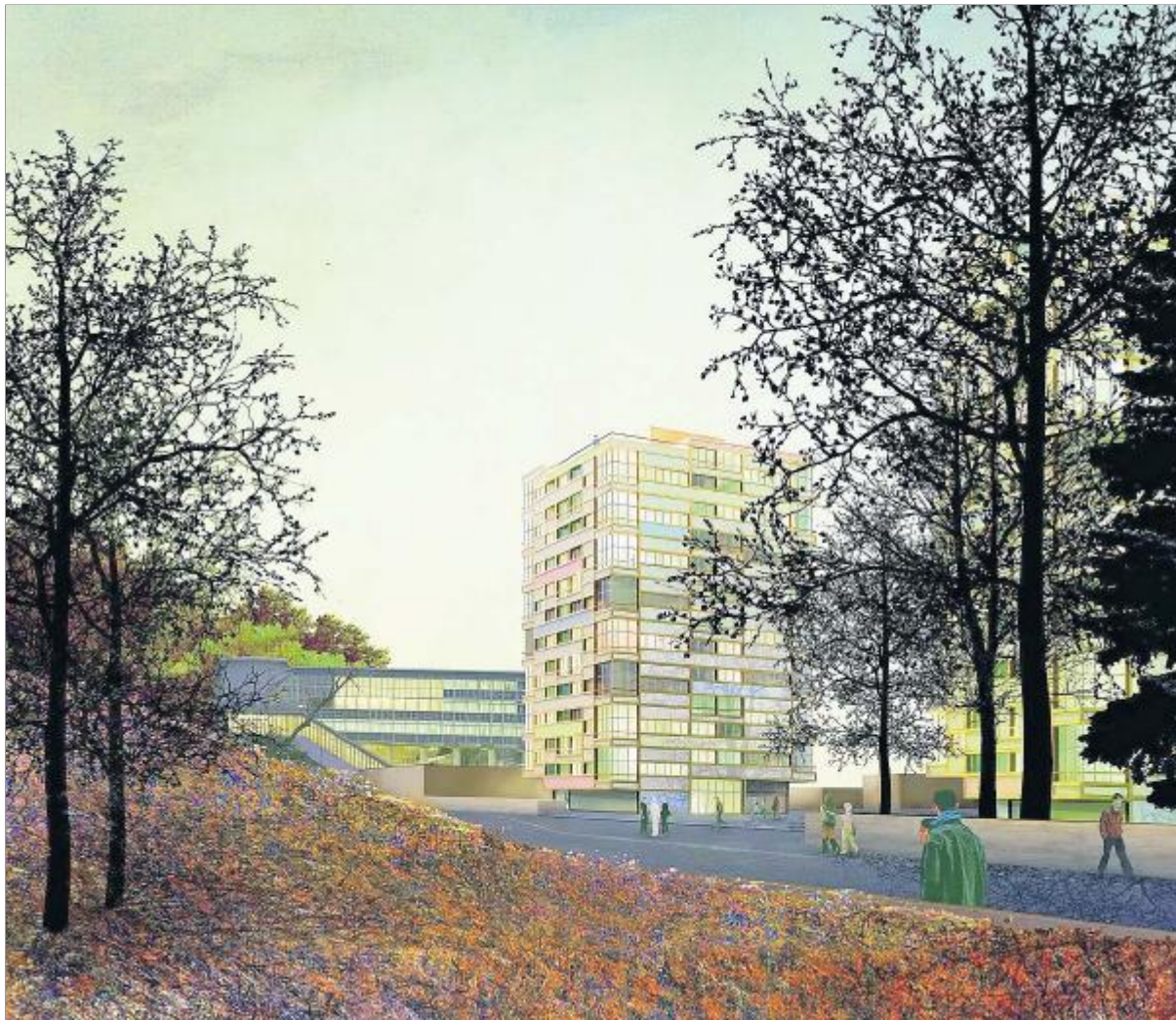
BELETAGE Die beiden hohen Wohnbauten an der Wiesenstrasse vor dem Martinsberggebäude. BURKARD MEYER

Die eineinhalbgeschossigen Wohnräume sind jeweils in den Gebäudeecken gestapelt, die Schlafzimmer auf den Längsseiten, sodass halbgeschossige Versätze von Ecke zu Ecke verlaufen. Dies schlägt sich zudem in einer abwechslungsreich gestalteten Fassadenhülle nieder, die